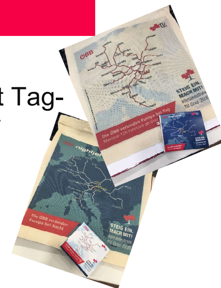
Meine klimafreundliche Dienstreise